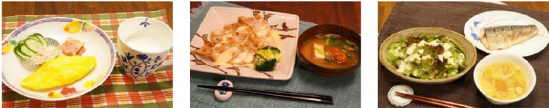
図1 ケトン食メニューの一例

(左)朝食:オムレツ*、ツナサラダ*、ベーコン、ケトンフォーミュラ、(中)昼食:豚肉ソテー*、みそ汁*、(右)夕食:サバの塩焼き、コンソメスープ*、チーズサラダ*。*には MCT を添加。