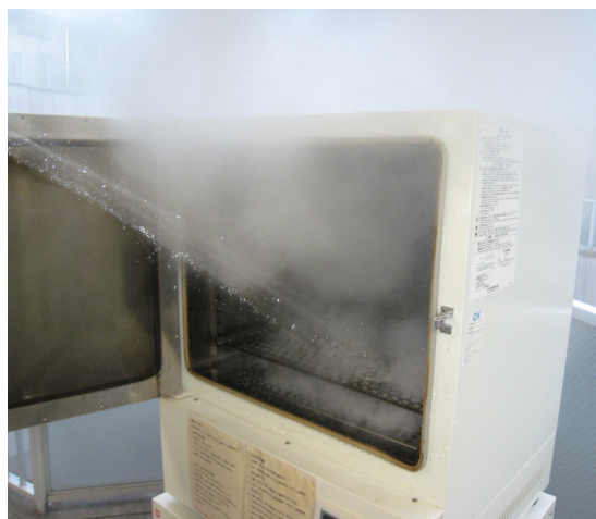
消火中の乾熱滅菌器 扉を開けた直後には炎も出ていた。