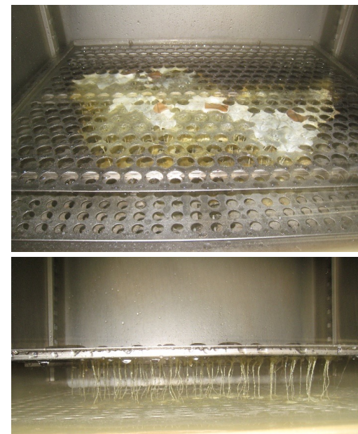
溶融したチューブ・容器