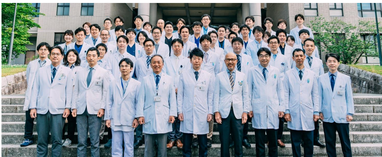
医局員集合写真（2023年）

豊富な症例数に基づいた研修により、運動器全般に関する的確な診断能力を身につけ、適切な保存療法、リハビリテーションを実践する。さらに基本手技から最先端技術までを網羅した手術治療を実践することで、運動器疾患に関する良質かつ安全な医療を提供する