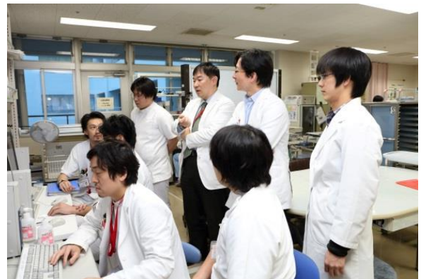
病棟での日常診療

専攻医に対する評価判定に他職種(看護師、技師等)の医療従事者の意見も加えて医師としての全体的な評価を行い、資料10:専攻医評価表(日本整形外科学会ホームページ参照)に記入します。専攻医評価表には指導医名以外に医療従事者代表者名を記します。