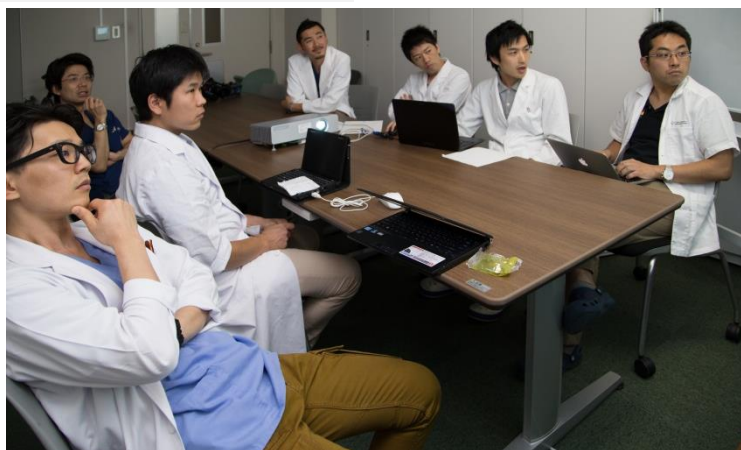
リサーチプログレス（研究進捗検討会）

専攻医は、整形外科研修カリキュラムに沿って研修し、整形外科専門医として、あらゆる運動器に関する幅広い基本的な専門技能（診察、検査、診断、処置、手術など）を身につけます。日本整形外科学会ホームページ掲載の資料2： 専門技能修得の年時毎の到達目標 に年時毎の到達目標が記されています。