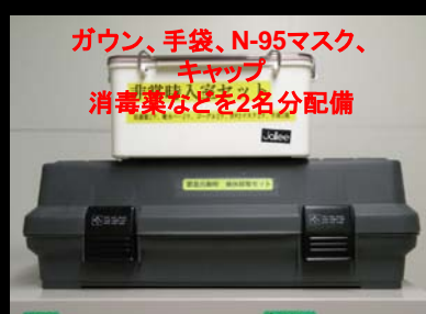
災害時入室セット