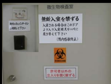
微生物検査室・正面ドア