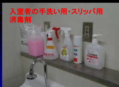
P-2 前室内手洗い：退室者用