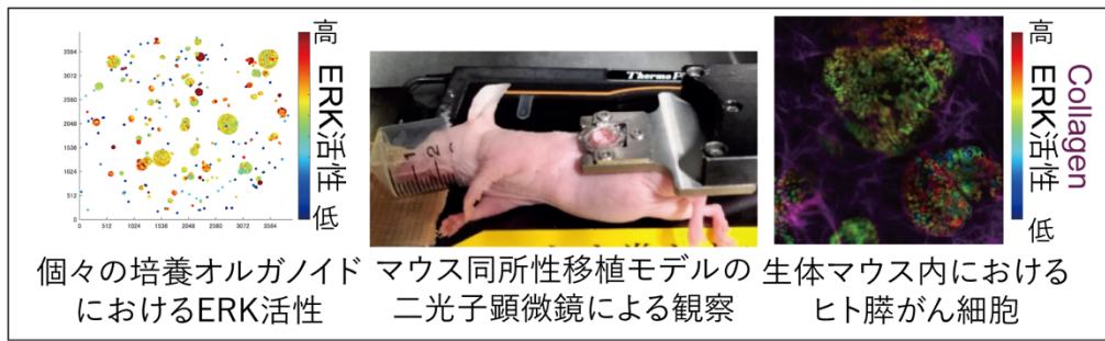
図 2：ヒトがんにおけるERK活性をシングルセル、生体でとらえる技術